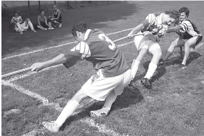
Anstrengung pur bei den Herren beim Seilziehen

im Fußball, Seilziehen und im Schubkarrenrennen um den Titel, bei den Damen ersetzte eine Partie Völkerball den Fußball. Bei allen 10 Teams – wiederum ein großer Andrang – wurde vollster Einsatz gegeben. Zum Vereinsmeister 2011 bei den Herren konnte sich