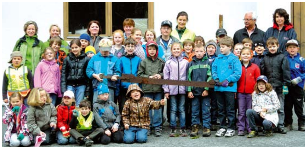
Unsere Volksschulkinder waren auch beim diesjährigen Umwelttag wieder sehr fleißig.