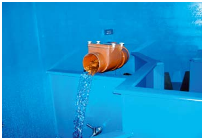
Quellstube von innen