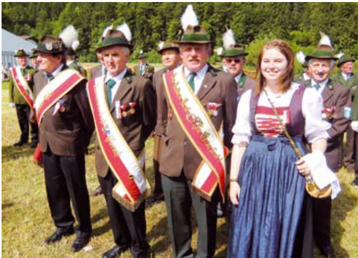
Die Kameradschaft Aurach nahm auch heuer bei der Landeswallfahrt des TKB, dieses Mal in Schwendt, teil.