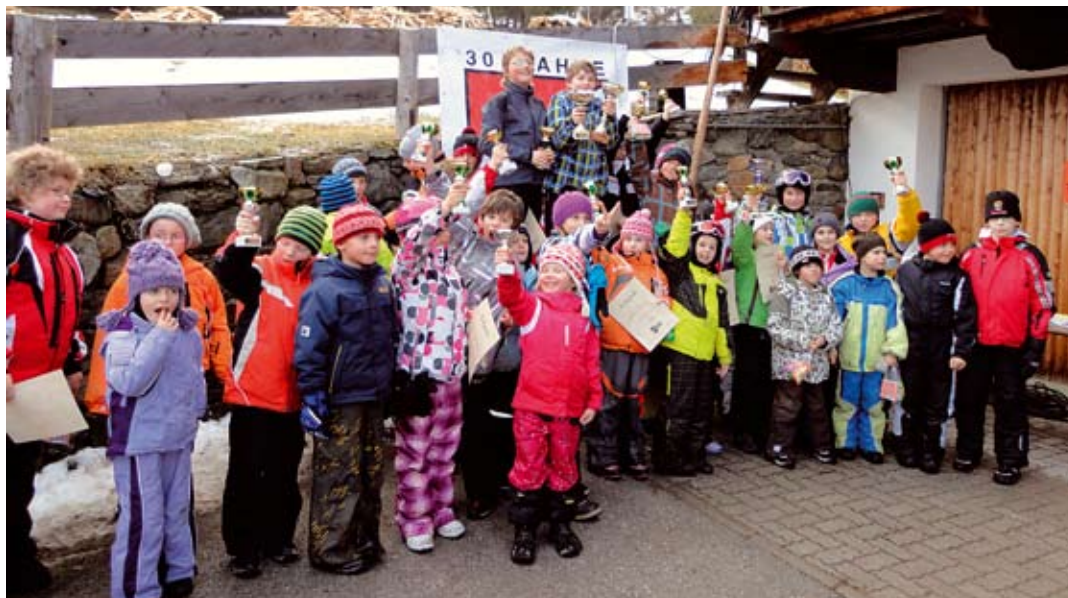
Unser Titelfoto zeigt die sportlichen Auracher Jungrodler bei der Preisverteilung vom Schülerrodeln am Blaufeld / Bergingen.